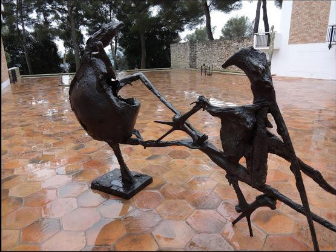
Germaine Richier - la montagne- 1955-1956