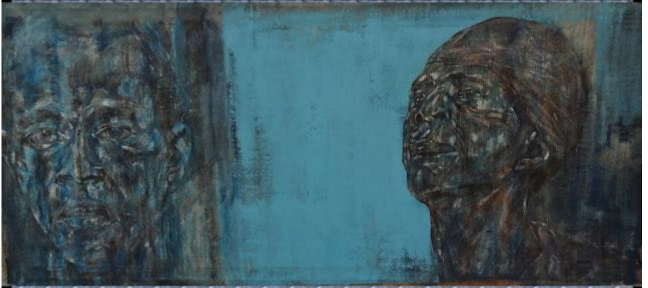
Léon Golub : 2 Black Men - 1990