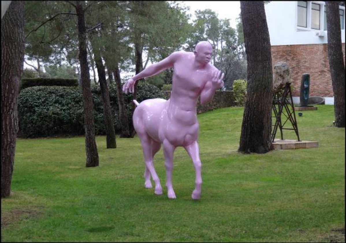
Assan Smati - le Centaure - 2008