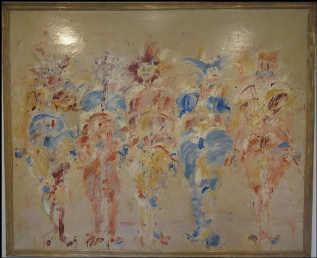
Louis cane - la revue - 1980-1981