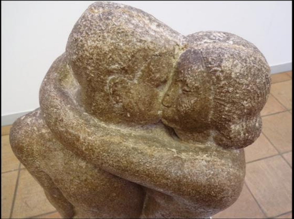
René Collamarini - Le baiser - 1927