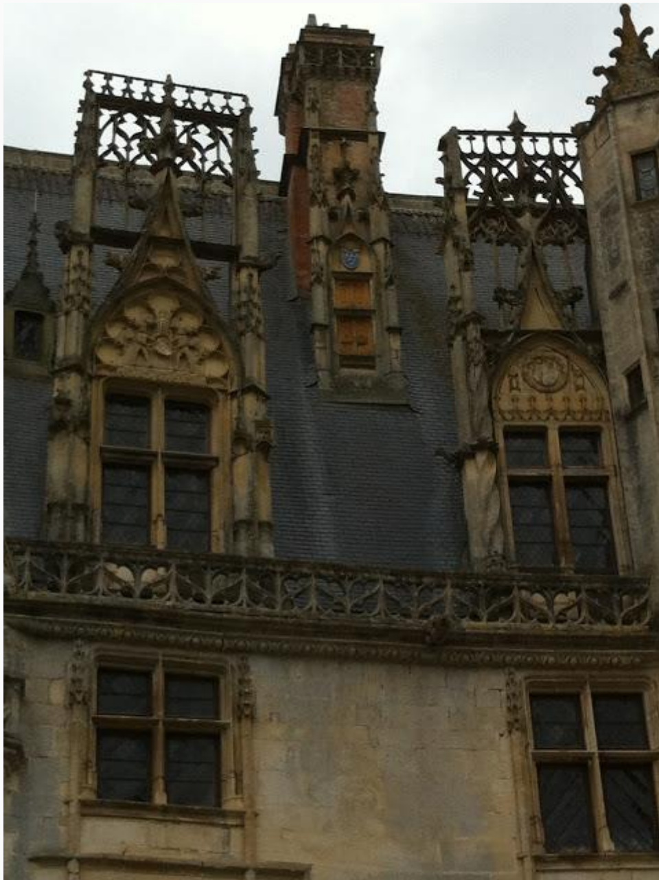
On remarque également les belles fenêtres à meneau et même la cheminée traitée en "fausse lucarne".