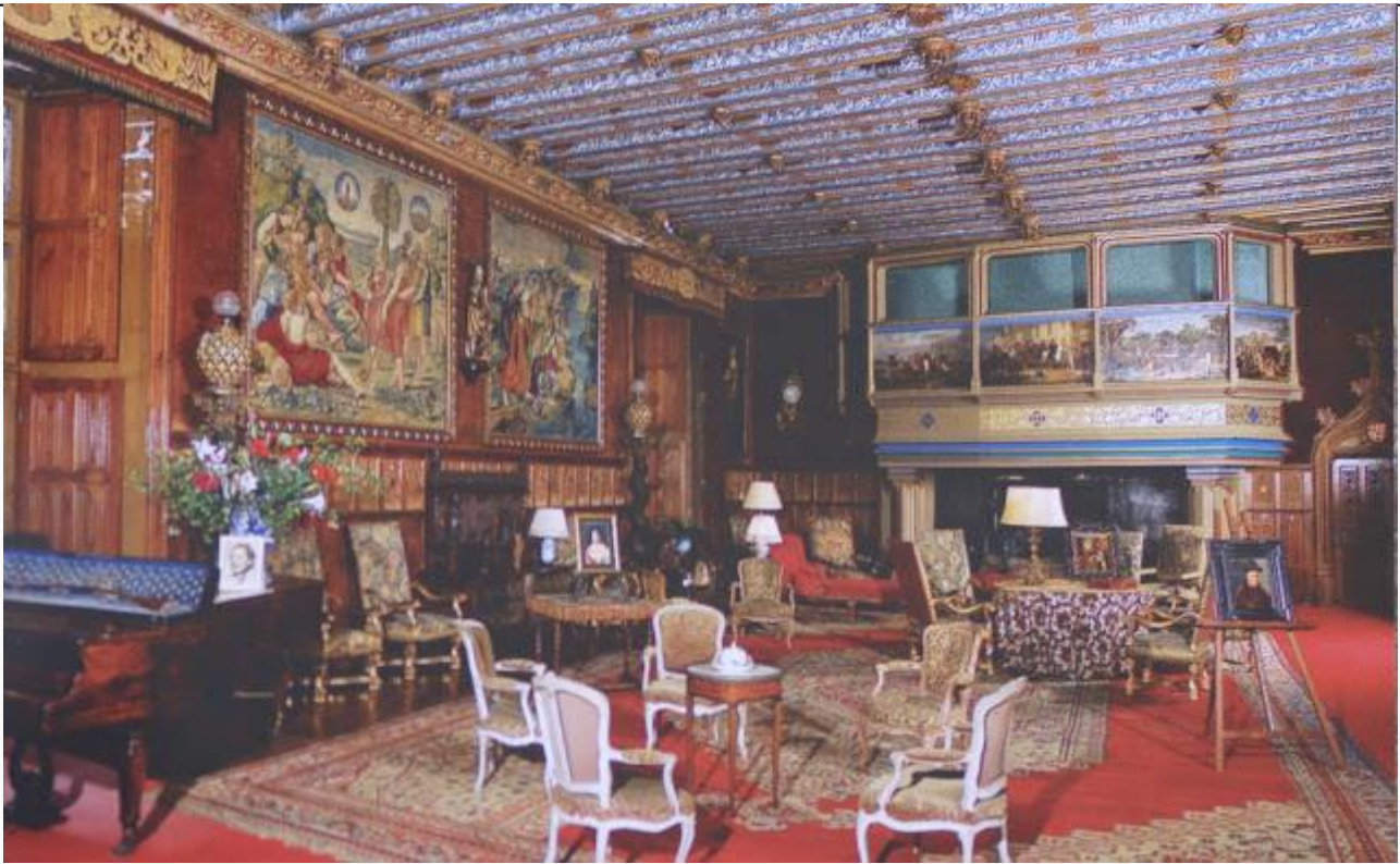
A l'intérieur, la grande salle d'apparat (9m sur 19m) est tout à fait admirable