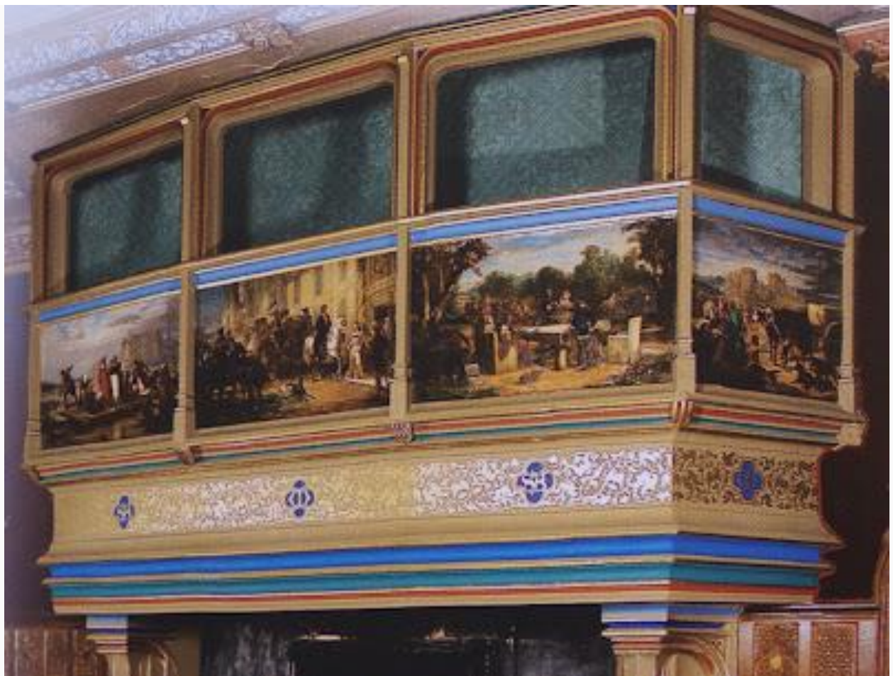
Avec la tribune pour les musiciens....