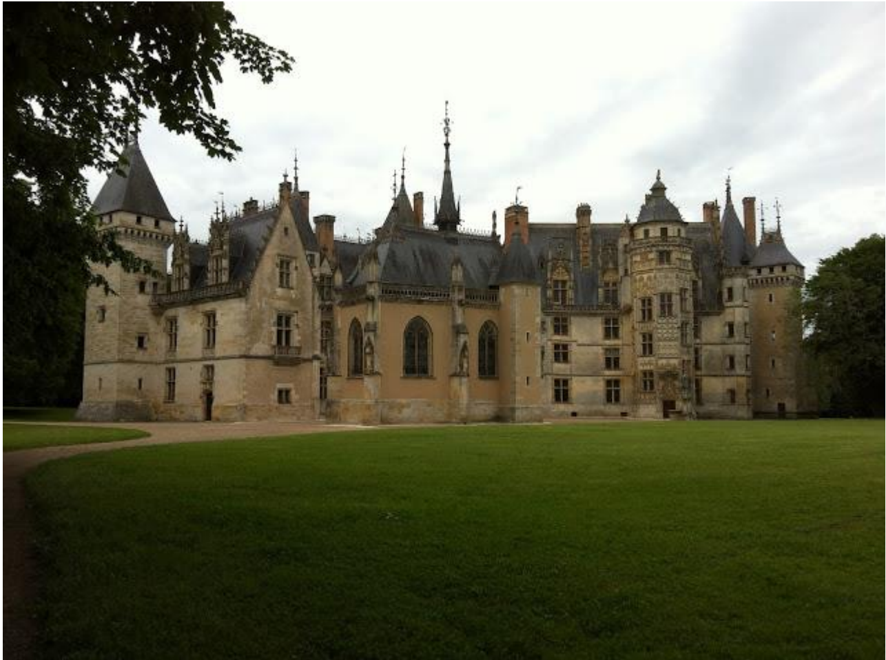
On voit aux extrémités les tours médiévales, restes de l'enceinte du château du XIVème siècle, dont on voit ci-dessous la façade.