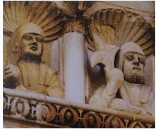
Au sommet de la tour, les guetteurs.